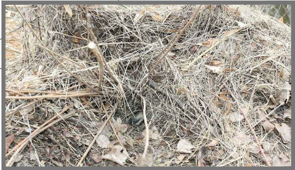
ÚKRYT PRO JEŽKY - J = 1x