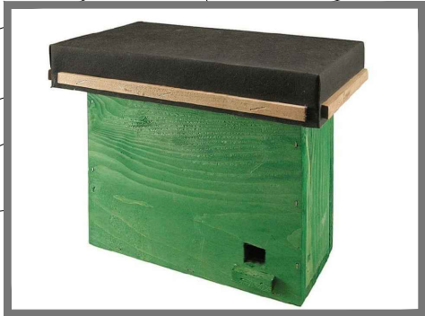
ČMELÍN - Č = 4x