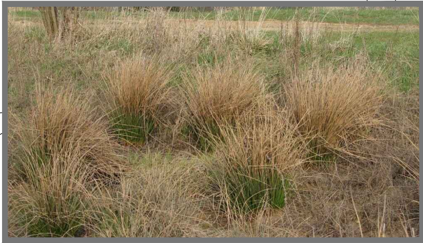
TUŇ - PTÁČNÍK - T = 2x