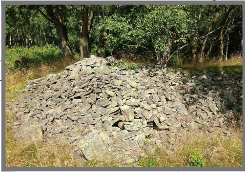
PLAZNÍK - P = 1ks